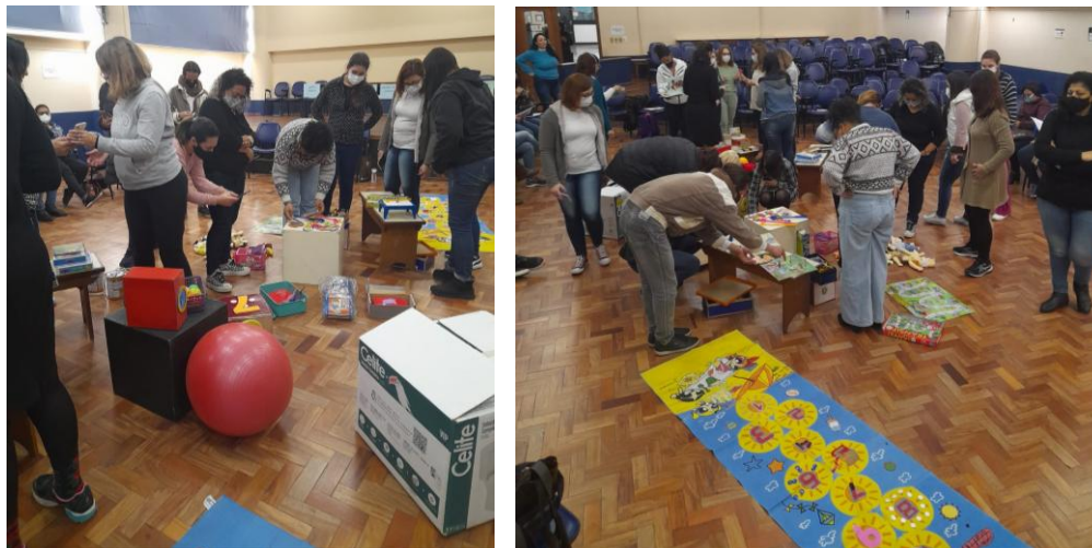
Figura 1 – Cursistas explorando os materiais utilizados nos atendimentos da EP e PI