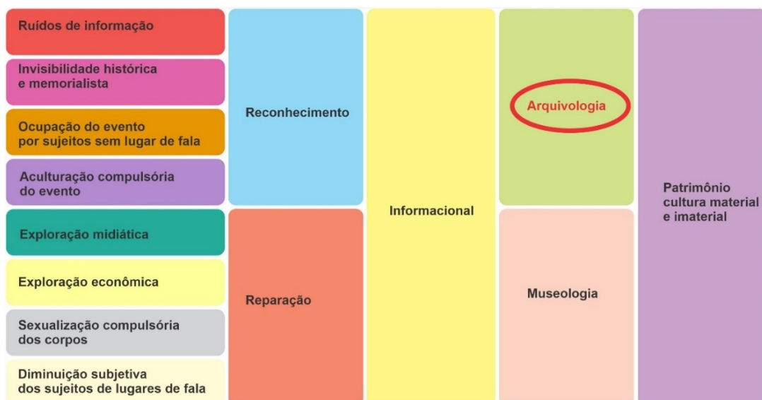
Quadro 1 – Áreas de contornos das problemáticas que demarcam o Sairé

A pesquisa identificou que a injustiça informacional e social em torno do fenômeno Sairé manifesta-se por meio de oito problemáticas, conforme apresentado no Quadro 1.